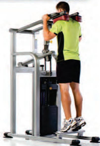
PPS-238 Standing Calf ماشین ساق پا ایستاده

Length x Width x Height: 57 x 26 x 67 in/145 x 66 x 170 cm Shipping Weight: 720 lb/327 kg