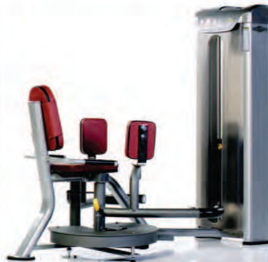
PPD-807 Inner/Outer Thigh ماشین داخل/ خارج پا

Length x Width x Height: 69 x 58 x 57 in/175 x 147 x 145 cm Shipping Weight: 580 lb/263 kg