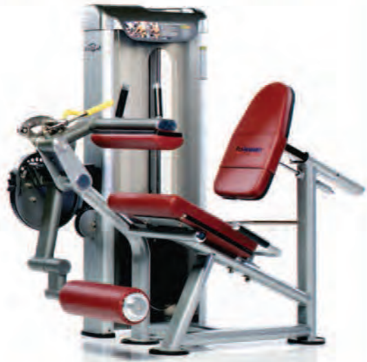
PPD-806 Leg Extension/Curl ماشین جلو/پشت پا

Length x Width x Height: 55 x 43 x 57 in/140 x 109 x 145 cm Shipping Weight: 620 lb/281 kg