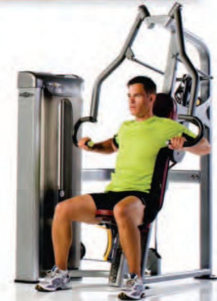
PPS-200 Chest Press ماشین پرس سینه

Length x Width x Height: 51 x 57 x 77 in/130 x 145 x 196 cm Shipping Weight: 610 lb/277 kg