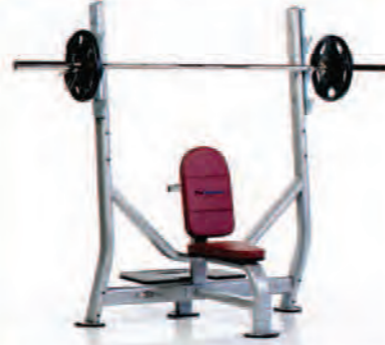
PPF-710 Olympic Military Bench

Length x Width x Height: 46 x 53 x 68 in/117 x 135 x 173 cm Shipping Weight: 240 lb/109 kg