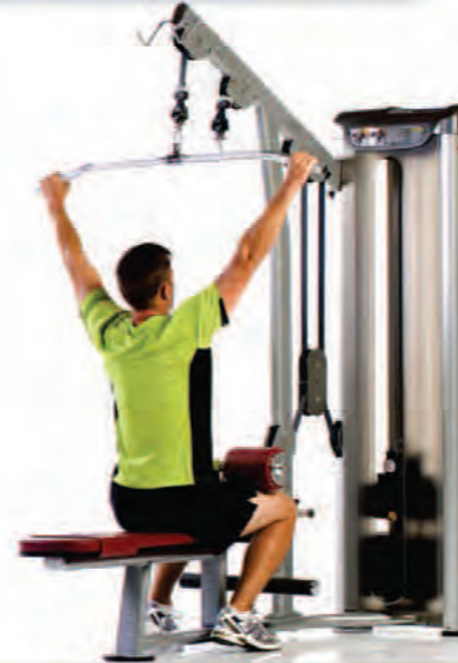
PPD-802 Lat/Mid/Low Row ماشین سیم کش لات قایقی رویینگ پشت بازو

Length x Width x Height: 68 x 48 x 89 in/173 x 122 x 226 cm Shipping Weight: 620 lb/281 kg