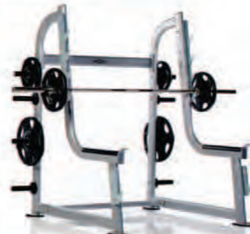
PPF-850 Squat Rack

Length x Width Height: 59 x 65 x 72 in/150 x 165 x 183 cm Shipping Weight: 340 lb/154 kg