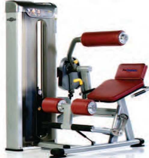
PPD-805 Abdominal/Back ماشین شکم/فیله کمر

Length x Width x Height: 49 x 42 x 57 in/125 x 107 x 145 cm Shipping Weight: 560 lb/254 kg