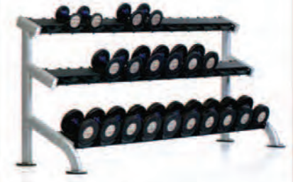
PPF-754 3-Tier Saddle Dumbbell Rack

Length x Width x Height: 31 x 100 x 44 in/79 x 254 x 112 cm Shipping Weight: 380 lb/172 kg