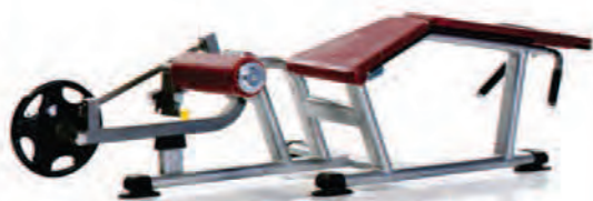
PPL-950 Prone Leg Curl پشت یا جیبیده بشقاب خور وزنه آزاد

LWH: 84x48x36 in/213x122x91 cm Wt: 180 lb/82 kg