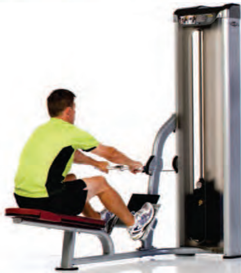
PPS-208 Low Row ماشین قلابی رومیگ

Length x Width x Height: 71 x 30 x 76 in/180 x 76 x 193 cm Shipping Weight: 530 lb/240 kg