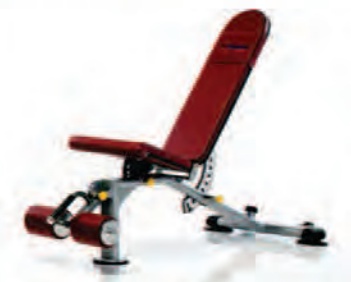
PPF-700 Multi-Adjustable Bench

Length x Width x Height: 68 x 29 x 50 in/173 x 74 x 127 cm Shipping Weight: 140 lb/64 kg