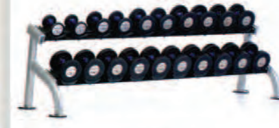
PPF-752 2-Tier Saddle Dumbbell Rack

Length x Width x Height: 30 x 100 x 29 in/76 x 254 x 74 cm Shipping Weight: 270 lb/122 kg