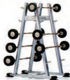
PPF-753 Barbell Rack

Length x Width x Height: 27 x 44 x 62 in/69 x 112 x 157 cm Shipping Weight: 240 lb/109 kg