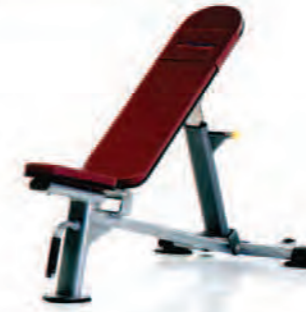
PPF-705 Adjustable Incline Bench

Length x Width x Height: 58 x 29 x 50 in/147 x 74 x 127 cm Shipping Weight: 140 lb/64 kg