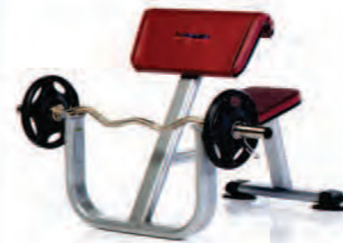
PPF-706 Preacher Curl Bench

Length x Width x Height: 40 x 28 x 43 in/102.71 x 109 cm Shipping Weight: 110 lb/50 kg