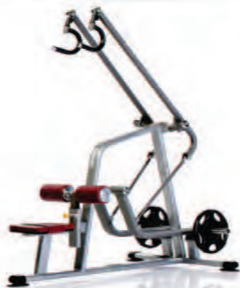
PPL-935 Lat Pulldown سیم کش لٹ بشقاب خور وزنه آزاد

LWH: 72x45x85 in/183x114x216 cm Wt: 250 lb/113 kg