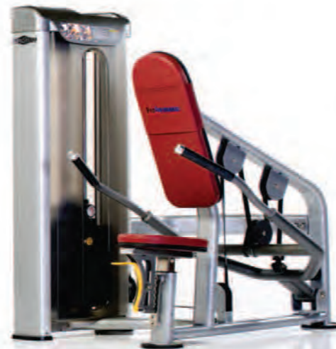
PPS-212 Tricep Press ماشین پشت بازو دپ

Length x Width x Height: 60 x 46 x 57 in/152 x 117 x 145 cm Shipping Weight: 540 lb/245 kg