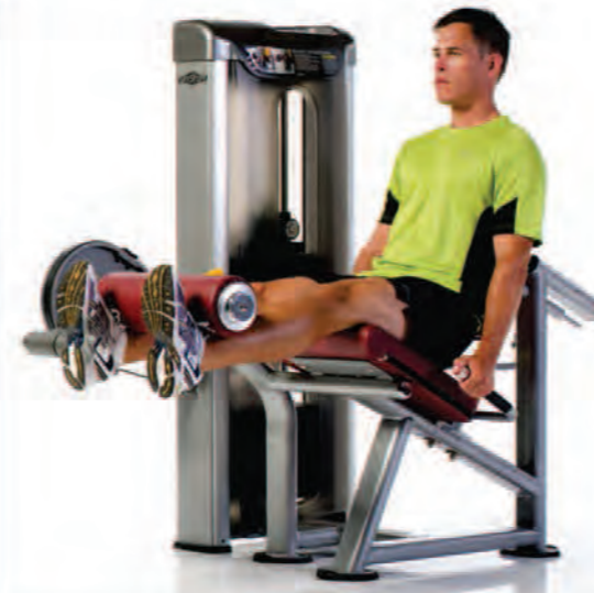
PPS-231 Leg Extension ماشین جاویا

Length x Width x Height: 53 x 43 x 57 in/135 x 109 x 145 cm Shipping Weight: 560 lb/254 kg