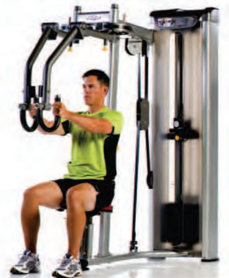
PPD-803 Pec Fly/Rear Delt ماشین قفسه/پشت

Length x Width x Height: 60 x 54 x 76 in/152 x 137 x 193 cm Shipping Weight: 620 lb/281 kg