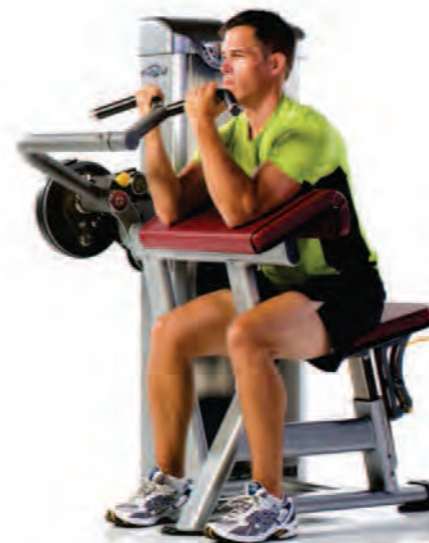
PPD-804 Biceps/Triceps ماشین جلو/پشت بازو

Length x Width x Height: 40 x 43 x 57 in/102 x 109 x 145 cm Shipping Weight: 520 lb/236 kg