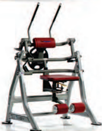
PPL-970 Abdominal Crunch انگم کراچ بشقاب خور وزنه آزاد

LWH: 48x43x70 in/109x122x178 cm Wt: 260 lb/118 kg