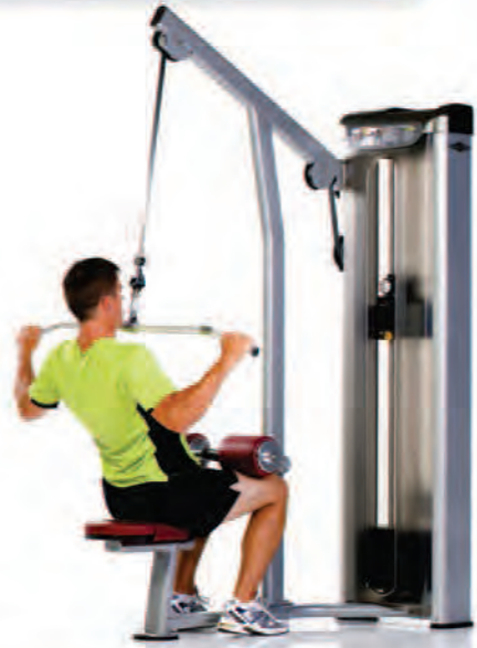
PPS-210 Lat Pulldown ماشین سیم کش ات

Length x Width x Height: 55 x 48 x 89 in/140 x 122 x 226 cm Shipping Weight: 530 lb/240 kg