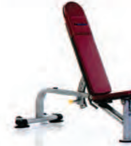
PPF-701 Flat/Incline Bench

Length x Width x Height: 59 x 25 x 51 in/150 x 64 x 130 cm Shipping Weight: 130 lb/59 kg