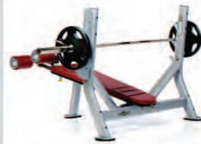
PPF-709 Olympic Decline Bench

Length x Width x Height: 71 x 53 x 43 in/180 x 135 x 109 cm Shipping Weight: 220 lb/100 kg