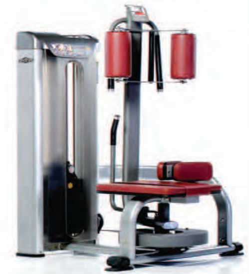
PPS-222 Rotary Torso ماشین پهلو مسگری

Length x Width x Height: 58 x 44 x 63 in/147 x 112 x 160 cm Shipping Weight: 620 lb/281 kg