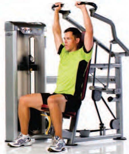
PPS-205 Shoulder Press ماشین پرس شانه

Length x Width x Height: 51 x 56 x 57 in/130 x 142 x 145 cm Shipping Weight: 600 lb/272 kg