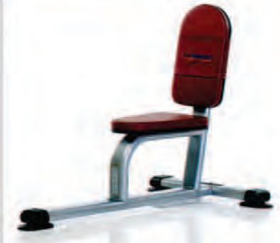
PPF-703 Utility Bench

Length x Width x Height: 52 x 29 x 37 in/132 x 74 x 94 cm Shipping Weight: 100 lb/45 kg