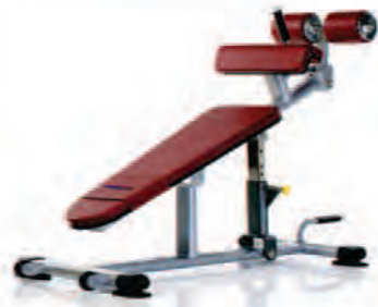
PPF-714 Adjustable Decline Bench

Length x Width x Height: 63 x 29 x 48 in/160 x 74 x 122 cm Shipping Weight: 160 lb/73 kg