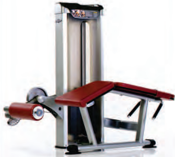
PPS-233 Prone Leg Curl ماشین پشت پا خوابیده

Length x Width x Height: 71 x 36 x 57 in/180 x 91 x 145 cm Shipping Weight: 520 lb/236 kg