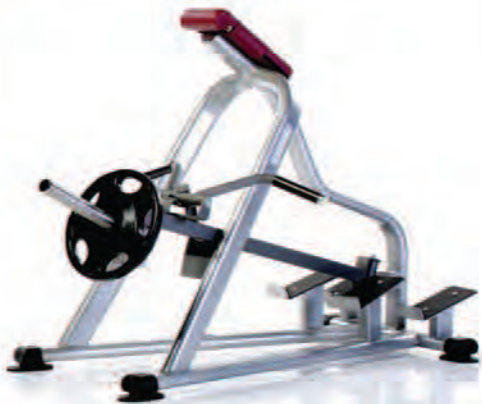
PPL-940 Incline Lever Row تیر بار

LWH: 78x47x48 in/198x119x122 cm Wt: 175 lb/79 kg