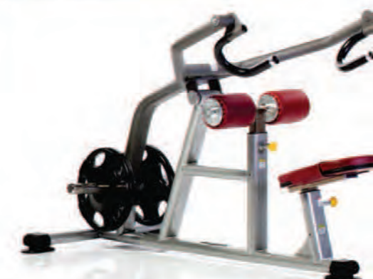
PPL-925 Seated Dip پرس پشت بازو جیب بشقاب خور وزنه آزاد

LWH: 63x40x42 in/160x102x107 cm Wt: 145 lb/66 kg