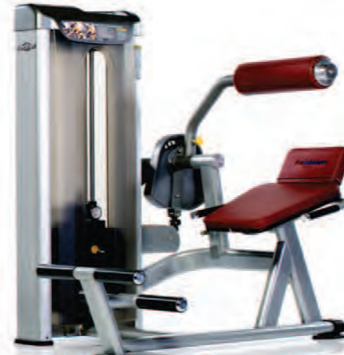
PPS-221 Back Extension ماشین فرجه کمر

Length x Width x Height: 47 x 42 x 57 in/119 x 107 x 145 cm Shipping Weight: 560 lb/254 kg