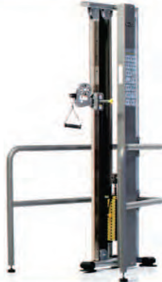
PPMS-240 Functional Trainer چندگاره تک ستونه

Length x Width x Height: 42x48x90 in/107x122x229 cm Shipping Weight: 380 lb/172 kg