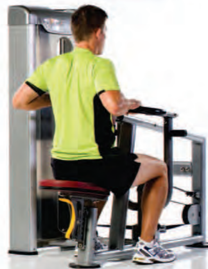
PPS-207 Seated Row ماشین قلابی

Length x Width x Height: 45 x 55 x 57 in/114 x 140 x 145 cm Shipping Weight: 560 lb/254 kg