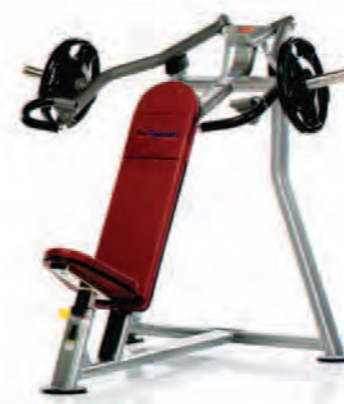
PL-910 Incline Press پرس بالاسینه بشقاب خور وزنه آزاد

LWH: 63x47x53 in/160x119x135 cm Wt: 175 lb/79 kg