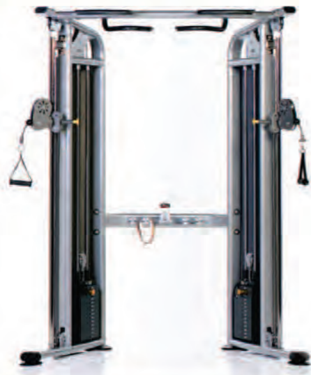
PPMS-255 Dual Adjustable Pulley ماشين گراس اور كامپيكت

Length x Width x Height: 42 x 68 x 90 in/107 x 173 x 229 cm Shipping Weight: 820 lb/372 kg