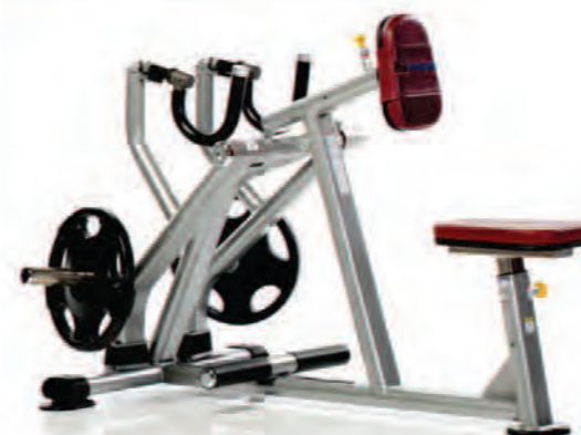
PPL-930 Seated Row کدامین بشقاب خور وزنه آزاد

LWH: 54x39x39 in/137x99x99 cm Wt: 150 lb/68 kg