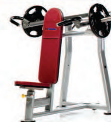
PL-915 Shoulder Press پرس سر شانه بشقاب خور وزنه آزاد

LWH: 55x47x47 in/140x119x119 cm Wt: 180 lb/82 kg