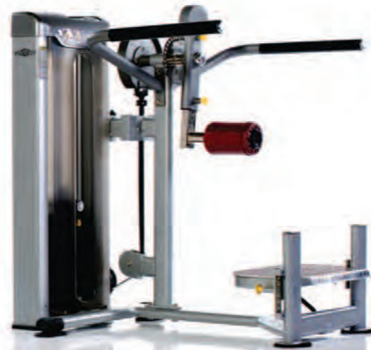
PPS-237 Multi-Hip Flexor ماشین خياطه

Length x Width x Height: 59 x 52 x 58 in/150 x 132 x 147 cm Shipping Weight: 620 lb/281 kg