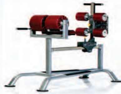
PPF-718 Glute-Ham Bench

Length x Width Height: 70 x 34 x 46 in/178 x 86 x 117 cm Shipping Weight: 240 lb/109 kg