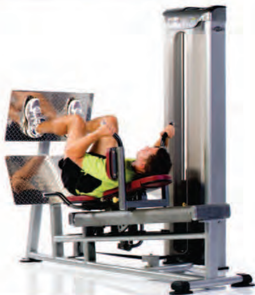
PPD-830 Leg Press/Hack Squat ماشین پرس پا هاگ پا

Length x Width x Height: 84 x 50 x 76 in/213 x 127 x 193 cm Shipping Weight: 880 lb/399 kg