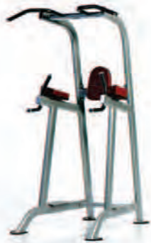
PPF-720 Chin/Dip/Leg Raise

Length x Width x Height: 55 x 37 x 89 in/140 x 94 x 226 cm Shipping Weight: 280 lb/127 kg