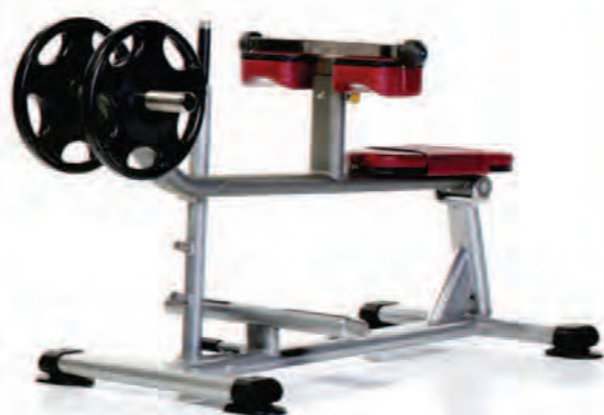
PPL-955 Seated Calf ساق یا نشسته وزنه آزاد

LWH: 33x56x35 in/84x142x89 cm Wt: 120 lb/54 kg