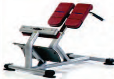
PPF-717 Back Station

Length x Width x Height: 51 x 33 x 41 in/130 x 84 x 104 cm Shipping Weight: 160 lb/73 kg