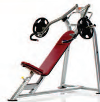
PPL-905 Chest Press پرس سینه بشقاب خور وزنه آزاد

LWH: 72x47x62 in/183x119x157 cm Wt: 205 lb/93 kg