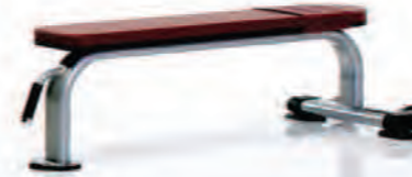
PPF-702 Flat Bench

Length x Width x Height: 58 x 25 x 18 in/147 x 64 x 46 cm Shipping Weight: 100 lb/45 kg