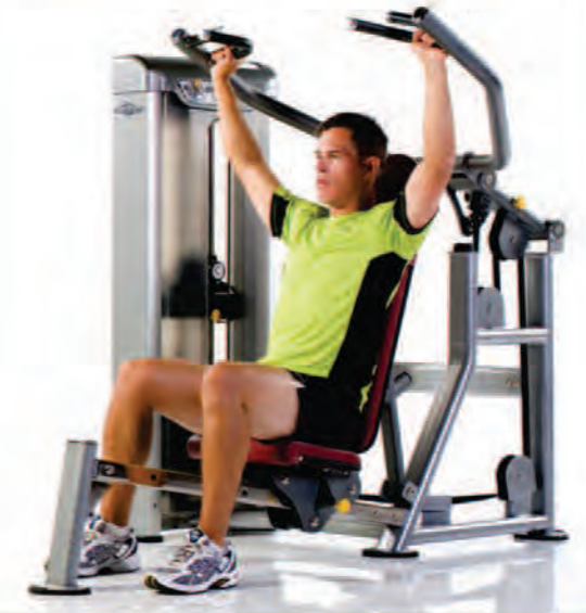
PPD-801 Multi Press ماشین مولتی پرس

Length x Width x Height: 77 x 55 x 57 in/196 x 140 x 145 cm Shipping Weight: 600 lb/272 kg