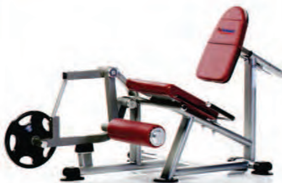
PPL-945 Leg Extension ساقیا بشقاب خور وزنه آزاد

LWH: 66x48x43 in/168x122x109 cm Wt: 170 lb/77 kg