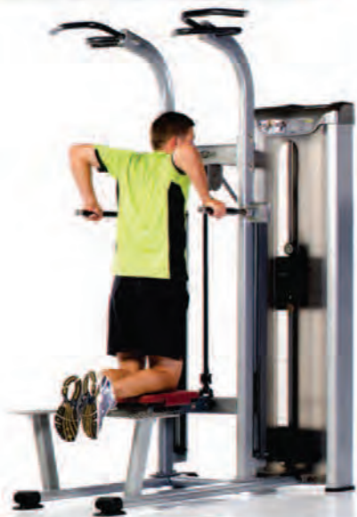
PPS-215 Assisted Chin/Dip ماشین پارالل و بارفیکس

Length x Width x Height: 69 x 48 x 90 in/175 x 122 x 229 cm Shipping Weight: 800 lb/363 kg