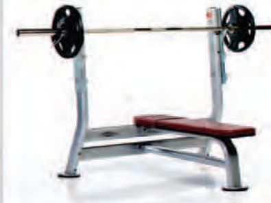
PPF-707 Olympic Flat bench

Length x Width x Height: 49 x 53 x 50 in/124 x 135 x 127 cm Shipping Weight: 170 lb/77 kg