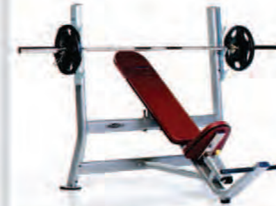
PPF-708 Olympic Incline Bench

Length x Width x Height: 71 x 53 x 55 in/180 x 135 x 140 cm Shipping Weight: 220 lb/100 kg