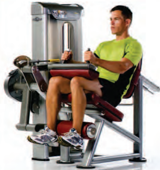
PPS-232 Seated Leg Curl ماشین پشت پا نشسته

Length x Width x Height: 64 x 41 x 57 in/163 x 104 x 145 cm Shipping Weight: 620 lb/281 kg