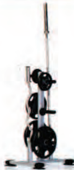
PPF-758 Olympic Weight Tree

Length x Width x Height: 27 x 25 x 44 in/69 x 64 x 112 cm Shipping Weight: 110 lb/50 kg