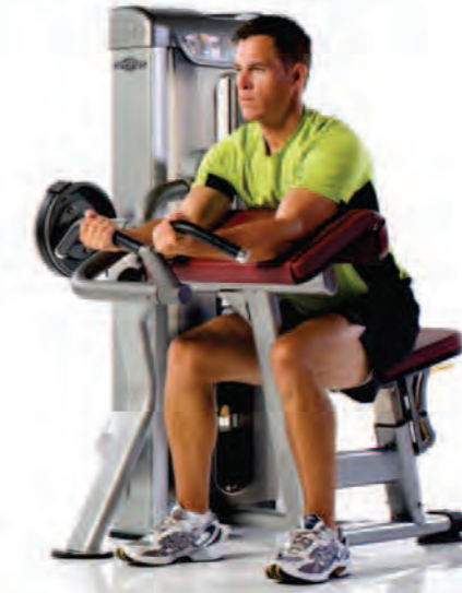
PPS-206 Biceps Curl ماشین جلو بازو

Length x Width x Height: 45 x 43 x 57 in/114 x 109 x 145 cm Shipping Weight: 510 lb/231 kg