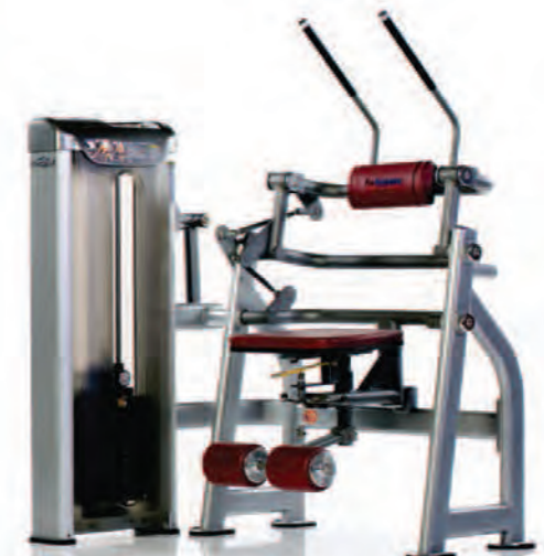
PPS-220 Abdominal Crunch ماشین شکم کرانچ

Length x Width x Height: 43 x 56 x 71 in/109 x 142 x 180 cm Shipping Weight: 640 lb/290 kg