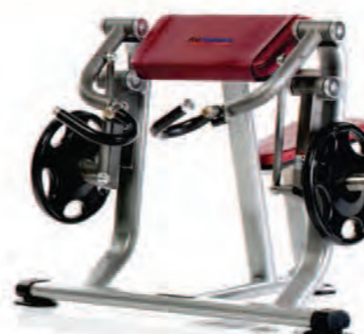
PL-920 Biceps Curl پرس جلو بازو بشقاب خور وزنه آزاد

LWH: 34x53x37 in/86x135x94 cm Wt: 170 lb/77 kg