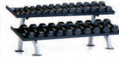
PPF-752T 2-Tier Tray Dumbbell Rack

Length x Width x Height: 30 x 84 x 31 in/76 x 213 x 79 cm Shipping Weight: 340 lb/154 kg