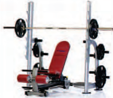
PPF-711 4-Way Olympic bench

Length x Width x Height: 89 x 63 x 66 in/226 x 160 x 168 cm Shipping Weight: 340 lb/154 kg